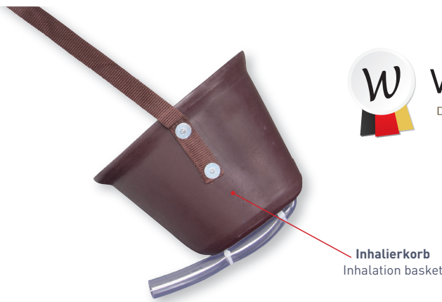
Inhalierkorb Inhalation basket

WALDHAUSEN DIE GANZE WELT DES REITSPORTS