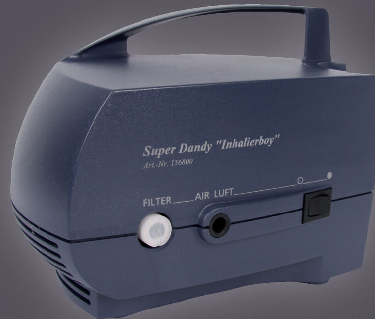
Super Dandy "Inhalierboy" Art.-Nr. 156800